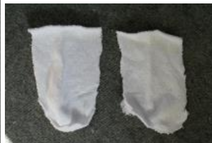
Sokkefoden delt i to stykker