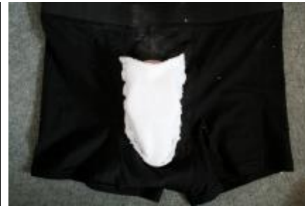
Packeren placeret i pouch (vrangen ud)