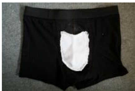
Pouch sat på med første runde sting (vrang ud)