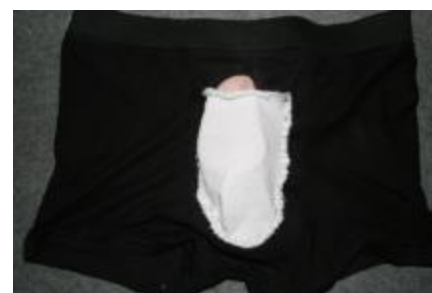
Pouch sat på med anden runde sting og packer (vrang ud)