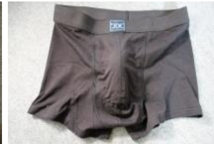
Packeren placeret i pouch (ret ud)