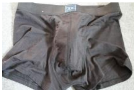
Pouch sat på med første runde sting og packer i (ret ud)