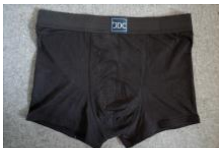
Pouch sat på med første runde sting (ret ud)