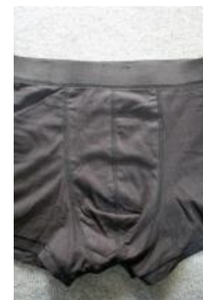
På de sorte briefs ses syningerne tydeligt på vrangen