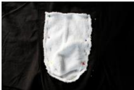
De store, løse sting løber langs nålene

Du kan nu vende vrangen på underbukserne indad igen (eller retten ud, om man vil), putte packeren i pouchen og prøve underbukserne på. Så får du en idé om, hvorvidt packeren sidder godt nok, om pouchen har den rette størrelse, placering osv., inden du syr den endeligt på plads.