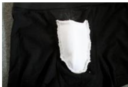
Pouch sat på med første runde sting og packer i (vrang ud)