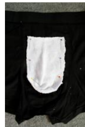
Her bruges seks nåle til monteringen

I teorien er det nok med to nåle i hver side af pouchen og én i bunden. Du skal ikke stikke nålen gennem mere end ét lag underbuksestof.