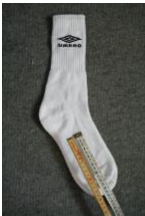
Mål 15 cm sok (eller stof) med forhåndenværende redskab

Trim eventuelt bredden på stofstykket, så det passer til dine underbukser og packer.