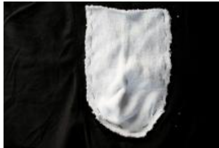
De store, løse sting uden nåle