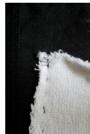
Sy mange gange her (og i det andet hjørne) for at fæstne tråden

Hvis du har lyst, kan du sy en runde mere for at være 200 % sikker på, at pouchen sidder fast. Her er anden runde syet med kastesting, men det er bedøvende ligegyldigt. That's it. God fornøjelse og arbejdslyst. Shake it if you've got it!