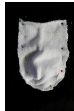
Nålene går gennem sokkestoffet og ét lag underbuksestof og tilbage igen