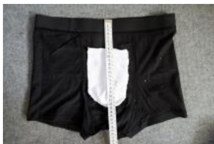
Pouchen placeres mellem de to syninger og ca. 8 cm. fra elastikkanten

Pouchen skal nu placeres på indersiden af underbukserne.