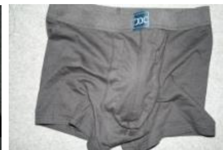
Pouch sat på med anden runde sting og packer i (ret ud)