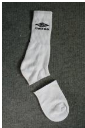
Klip-klip og du har nu en sokkefod