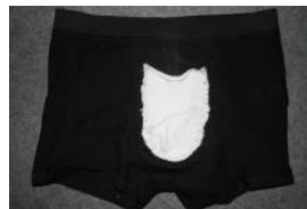
Pouch sat på med anden runde sting (vrang ud)